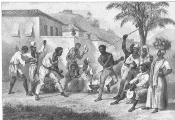
Figura 2 - Danse de la guerre (1835) - primeiros registros do que modernamente chamamos de Capoeira.