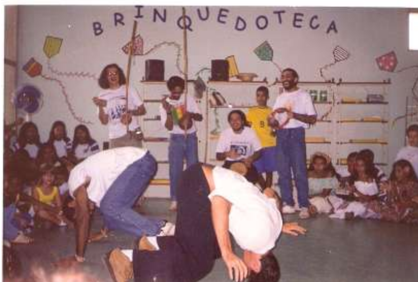
Figura 5 - Roda de Capoeira realizada na Fundação Tancredo Neves com os integrantes do NUCAAL. Acervo de Anis Abdul.

O NUCAAL merece reconhecimento pela quantidade de capoeiristas que formou na cidade, sendo marco na história da capoeiragem belenense, assim como espécie de “precursor” do movimento da Capoeira Angola, na Universidade Federal do Pará. Tem uma ligação com a história da Capoeira Angola, posto que na fala de antigos integrantes do grupo, havia desde esta época uma constante busca pelos princípios desta modalidade. Este interesse de alguma forma prepara um espaço para a chegada da Capoeira Angola na UFPA. Entretanto, a organização da bateria de outra forma, a ausência de uniforme e da utilização de calçados entre outros motivos caracterizam uma maior afinidade deste núcleo com a Capoeira Regional do que com a Capoeira Angola.