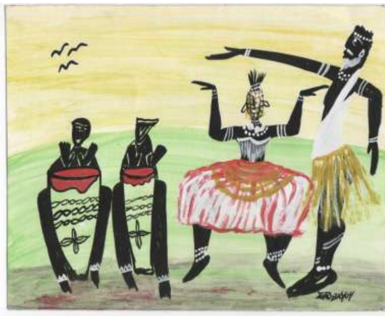
Figura 11 - Gravura de Mestre João Angoleiro – MG – 2004