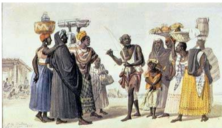
Figura 3 Jean Baptiste Debret Joueur d'Uruncungu (1826). Primeiros registros do que modernamente chamamos de Capoeira.

Ocupando lugar ambíguo no imaginário brasileiro ao longo do século XIX, a capoeira começa a tomar a forma de maltas compostas por negros, mulatos e estrangeiros utilizados para “serviços eleitorais” pela classe dominante: roubos, vinganças a inimigos políticos, badernas. As maltas eram associadas à marginalidade, contendo um forte elemento hierarquizador nas suas estruturas.