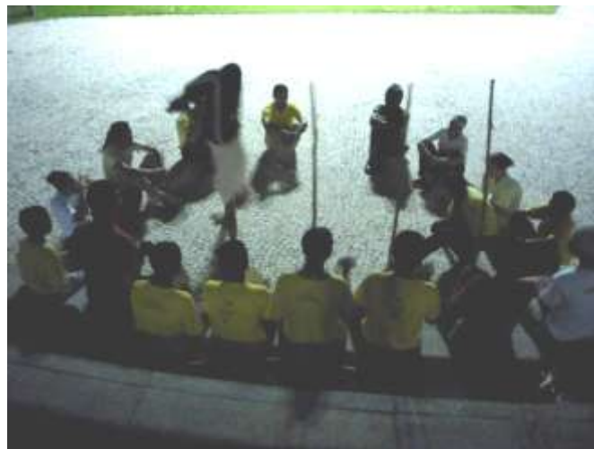
Figura 13 - Roda de Capoeira Angola na Casa das Onze Janelas, com crianças da comunidade quilombola de Macapazinho e frente de trabalho de Belém do grupo Eu Sou Angoleiro . Belém, janeiro de 2009.

O que estes corpos transformados representam? Quais os significados de cada postura corporal dentro do universo da Capoeira Angola? Questionamentos que passam por questões