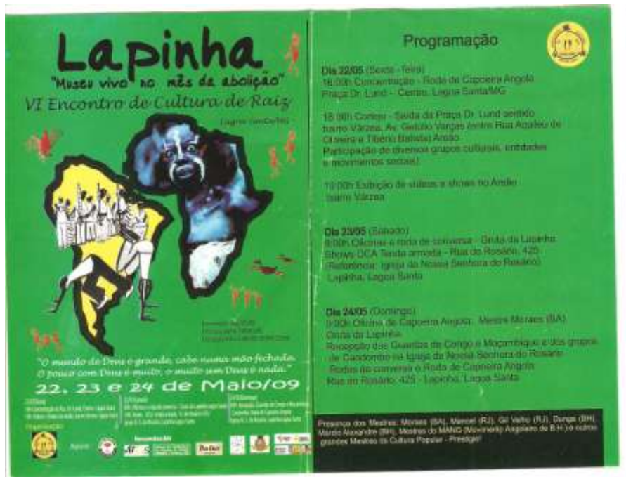
Figura 21:Folder com a programação do evento Lapinha Museu Vivo no Mês da Abolição .