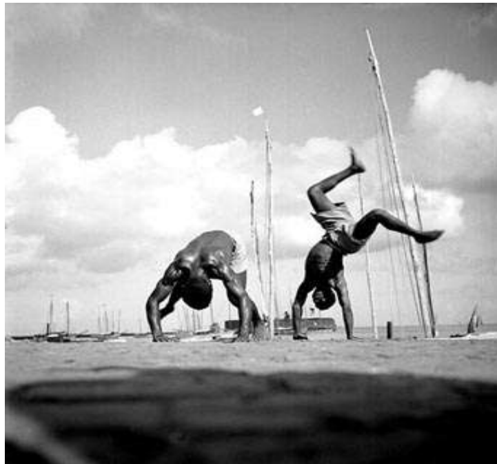
Figura 22 O corpo ondulado, dilatado que opera em várias dimensões.

o olhar atento também é treinado inclusive e explorando a visão periférica que permiti ao capoeirista um elevado grau de acerto na defesa e considerando tal movimentação total do corpo, o olhar conseqüentemente pode partir de cima para baixo e enfim , podendo ser ele a partir dos diferentes planos, seja de cabeça para cima, de lado ou de cabeça para baixo.