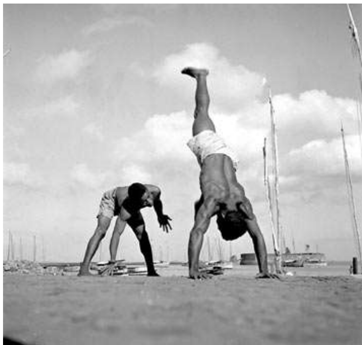
Figura 23 Posturas que demonstram as várias possibilidades do olhar na capoeira.

Nos corpos simbólicos, a estética dos angoleiros também é repleta de símbolos e pode ser vista como detentora de uma funcionalidade mágica ritual. Posso citar alguns dos objetos que assumem a função de segurança dos usuários: rosários, escapulários, medalhas, panos amarrados na cabeça, tocas, tatuagens, guias, colares e boinas com as cores do movimento negro mundial (verde, amarelo, vermelho e preto), fitas de santos etc. O símbolo sempre tem a ver com o que não está presente, funcionando os objetos sagrados como espécie de hierofania, manifestação do transcendente no imanente. Outro traço de identidade é a valorização dos cabelos crespos, para os angoleiros na atualidade, que utilizam tranças, blacks, dreadlocks 59 . Para Jocicleide (Belém, maio/2010):