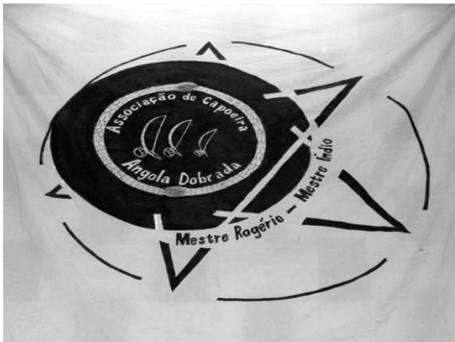
Figura 6 - Emblema do grupo Angola Dobrada, carregada de alguns dos símbolos que permeiam a Capoeira Angola, como a estrela de Salomão, a cobra e o berimbau.