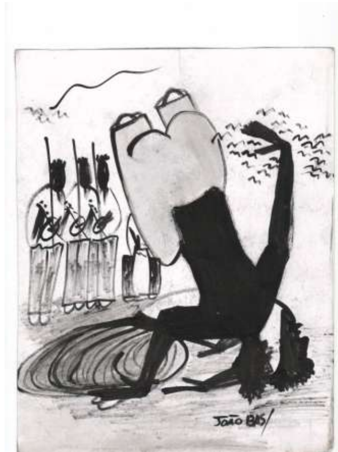
Figura 20 Gravura do Mestre João Angoleiro, Belo Horizonte, 2009.

As figuras geométricas desenhadas pelos corpos dos brincantes, pela disposição dos instrumentos e de como as pessoas se organizam no espaço físico para fazer o ritual, como o círculo, o triângulo, além da utilização de símbolos como a cruz , a insígnia de Salomão, a cobra ,a zebra, o berimbau, entre outros, compõe o panteão dos arquétipos acessados na Capoeira Angola, na qual a forte relação com o chão, traz a idéia de culto a “Terra Mãe”.