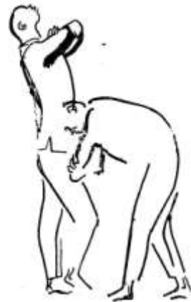
Figura 17 Desenho de Carybé, do início do século XX, de uma postura conhecida na Capoeira Angola como Chamada de Angola .