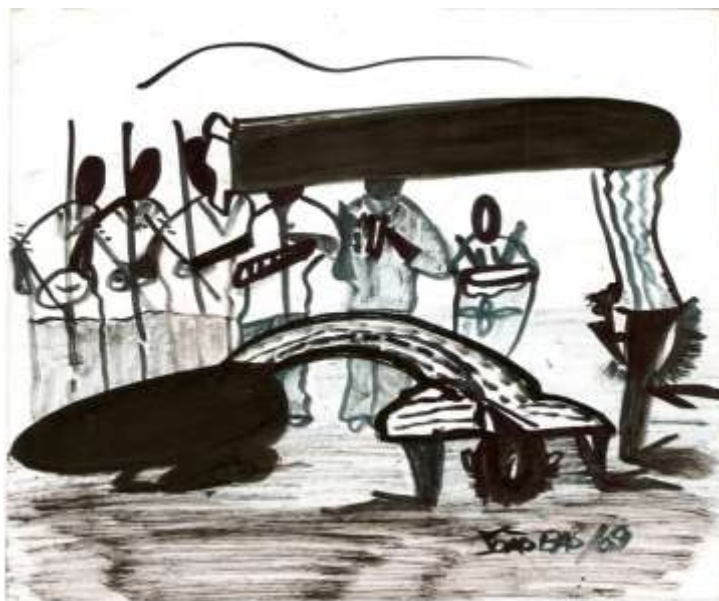
Figura 14 Gravura de Mestre João Angoleiro, Belo Horizonte, 2009. A imagem ilustra bem a mudança do ponto de equilíbrio cotidiano, que mantém o corpo ereto, para um ponto de equilíbrio precário extra-cotidiano, típico na Capoeira Angola.

Segundo Rodrigues (1983), o corpo possui aspectos instrumentais e aspectos expressivos. Na Capoeira Angola isto pode ser observado em dois momentos distintos para os capoeiristas: os treinos e as rodas. Os treinos se dão normalmente duas vezes por semana e a roda uma vez por semana, na maioria das casas que conheci, sendo a roda o momento no qual o corpo, através da utilização das técnicas adquiridas durante a semana, através dos treinos, torna-se mais expressivo que instrumental, pois se espetaculariza, expressando idéias e estados espirituais, fazendo-se símbolo. Técnica e sentimento estão desta forma, unidos no corpo do angoleiro . Corpo e espírito são indissociáveis.